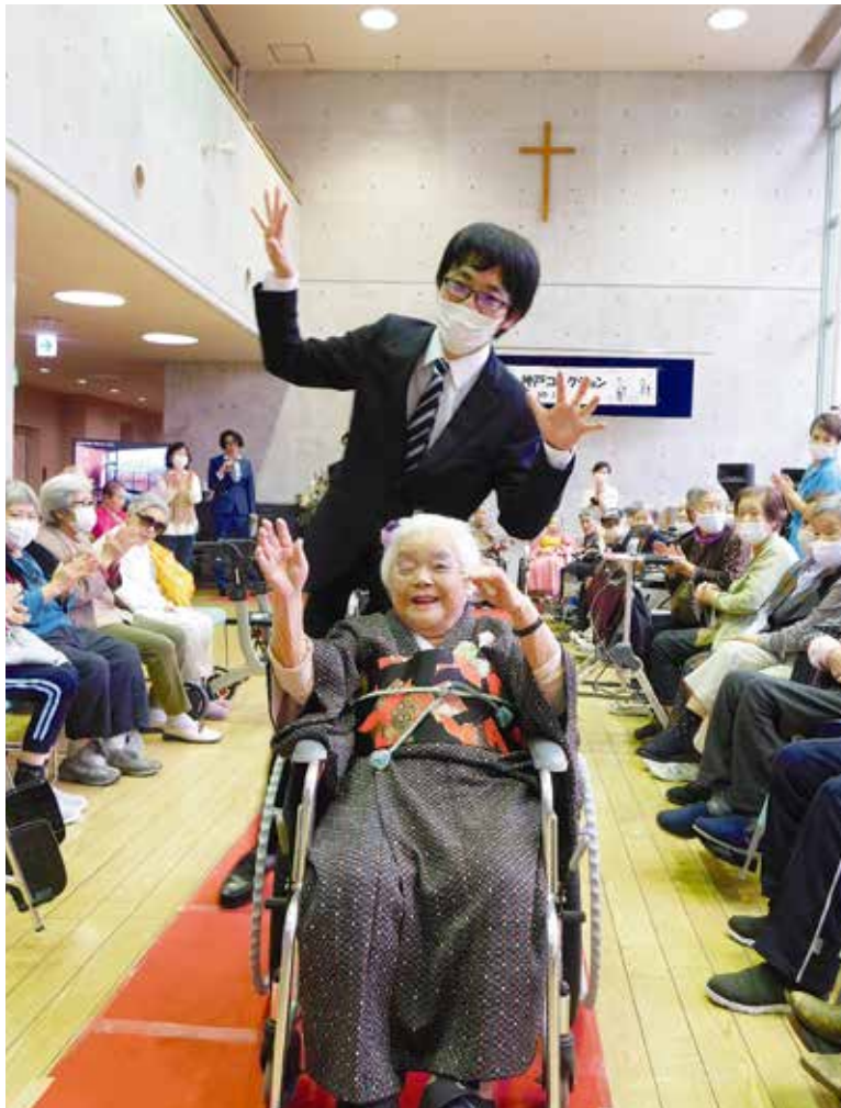
3年ぶりのファッションショーを開催(故郷の家・神戸で19ページに関連記事)