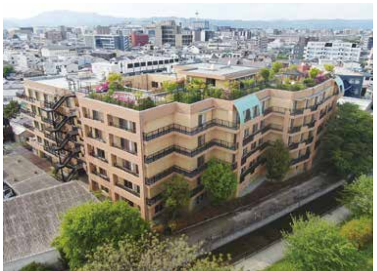
工事が完了した故郷の家・京都（2023年4月。ドローンによる撮影）

故郷の家・京都の外壁補修工事が4月30日に完了した。故郷の家・京都は2008年に建物が完成、翌年開設されたが、早くも12年2月には施工不良による外壁タイルの剥離が発生、その後も剥離や崩落が繰り返し起こっていた。安全対策のため17年8月には外壁タイル落下防止用養生ネットを正面付近に設置。その後19年には建物全体がネットで覆われるに至った。