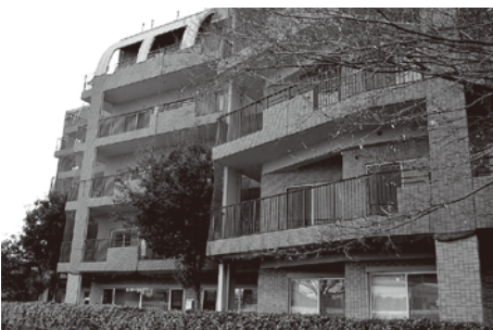
ネットで覆われた故郷の家・京都

故郷の家・京都では外壁のタイルが浮いて、剥落することもあり、建物全体をネットで覆い、安全対策を取っています。施工不良が原因のため、建築請負業者と話し合い、昨年11月に和解が成立、近く改修工事が始まります。