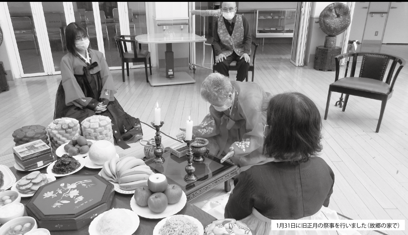
1月31日に旧正月の祭事を行いました(故郷の家で)