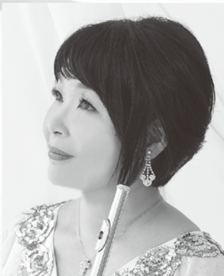
作曲 紫園 香 (しおん かおり)

私が一番悲しいのは みんな沈んでしおれて黙る時 誰かが病にたおれた時 冬の夜帰らない子がある時 この世はみんな神のもの あなたは大事な子供です はやく大きくなりなさい 立派な大人になりなさい