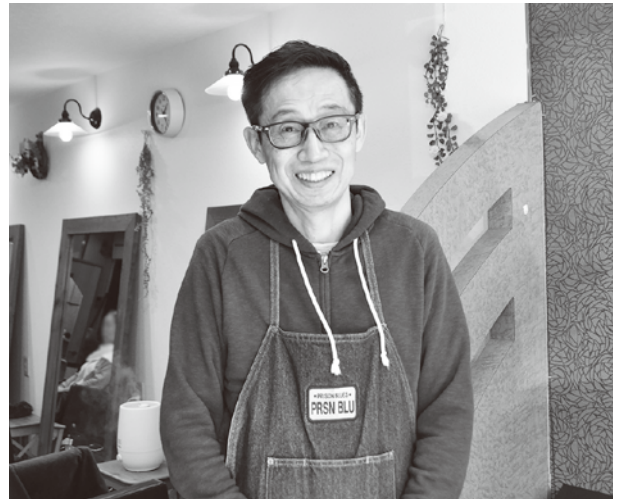
「GARAKUTA (ガラクタ) 生野店」にて

故郷の家・介護サポートセンター大阪に2か月ごとにプロの美容師がやってきて、デイサービスの一角が美容室に様変わりします。センスの良い美容師にカットしてもらおうとご利用者はこの日を待ちわび、多い日は約20人のご利用者が順番を待っています。ご利用者はカットをしてサッパリ。みなさん大喜びです。10年前からボランティアで来所する